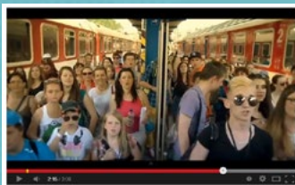
▶ Finálový den ročníku 2013