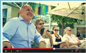
▶ Finálový den ročníku 2012