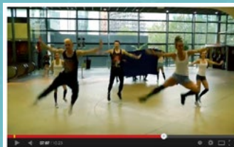
▶ Brusel očima finalistů