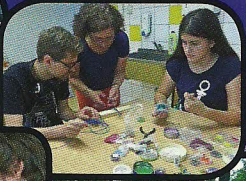
Sport- und Kreativprogramm